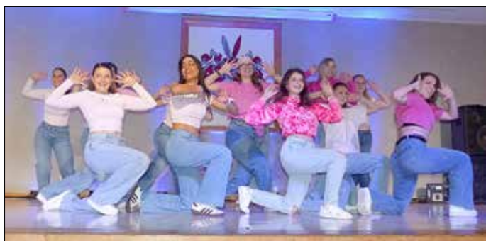
Die Showtanzgruppe „Insinity“

Die acht Tänzerinnen der TG Phantomenia aus Kettenbach boten „Top of the Pops“, Rhythmen aus den 90er Jahren, die bunt, lebhaft und unangepasst waren.