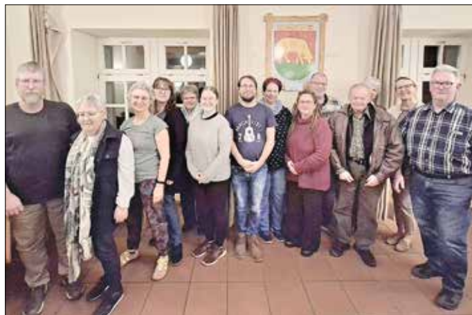
Der neue Vorstand

mit dem Vocalensemble Diez und unterstützt durch das Diezer Instrumentalensemble einen großen Projektchor im adventlichen Aartal. Unter dem Titel „Chorals of Joy“ (Choräle der Freude) werden - vorbereitet durch mehrere gemeinsame Probentage - zwei wunderbare Konzerte mit Stücken von John Rutter in der Rundkirche Oberneisen (29.11.26) und der Stiftskirche Diez (28.11.26) präsentiert.