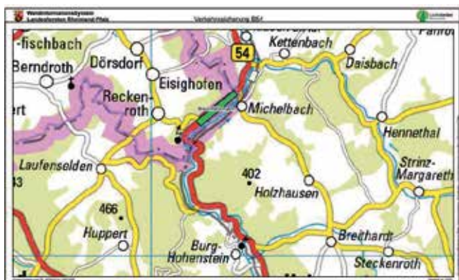
Kartenauszug WaldinformationsSystem Landesforsten Rheinland-Pfalz Autor: Manfred Trenkhorst