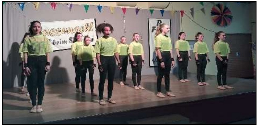
Auftritt in Gutenacker

Es gab überall positive Resonanz und wir können uns auf weitere Auftritte in der aktuellen Saison freuen.