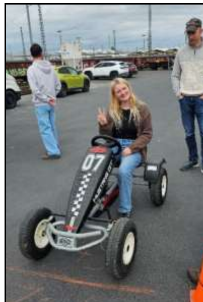
Vor dem Start zum Kettcarparcours