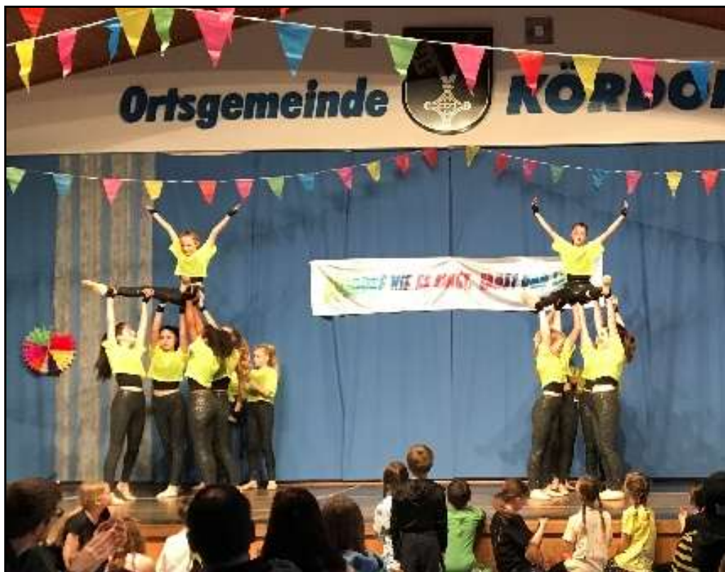
Auftritt der Diamond Lights

Nach kurzer Pause war der gemeinsame Einmarsch der Rope Skipping Gruppen 1 und 2. Stolz konnten sie sich mit ihren neuen selbst bemalten T-Shirts präsentieren. Zunächst war die Gruppe 1 an der Reihe und zeigte den Cup Song und Sprünge mit ihren Ropes, einzeln und zusammen.