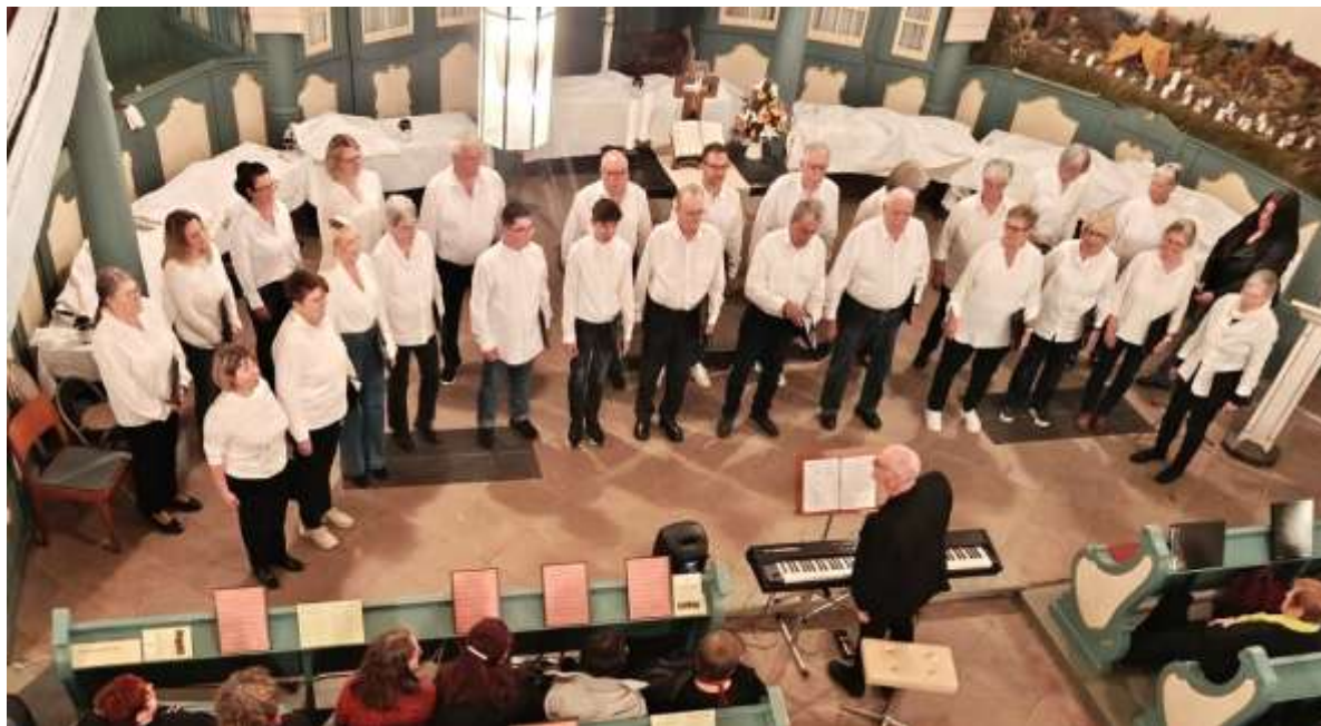
Vokalis beim Auftritt in der Kirche Klingelbach

Nur zwei Tage nach unserem Auftritt in Klingelbach hatten wir eine besondere Herausforderung zu bewältigen. Der SWR hatte die Ortsgemeinde Kördorf für einen Livebericht über das Dorfleben ausgewählt. Vielleicht haben einige Kördorfer die SWR-Landesschau mit drei Live-Schaltungen nach Kördorf gesehen. Vokalis war am 21. April um 19.00 Uhr bei der Chorprobe in einer Live-Sendung. Das war für uns neu und herausfordernd, denn viele