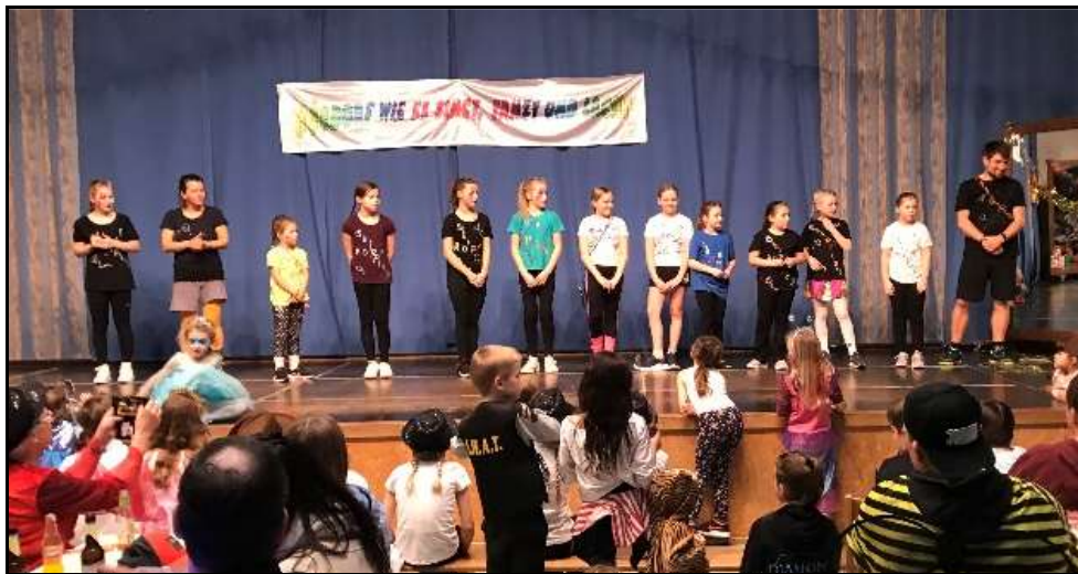
Auftritt Rope Skipping Gruppe mit neuen selbst bemalten Shirts

Zwischen den Programmpunkten nutzten die Besucher die Gelegenheit sich bei Faschingsmusik mit Getränken, Würstchen, Berlinern und Donuts zu stärken.