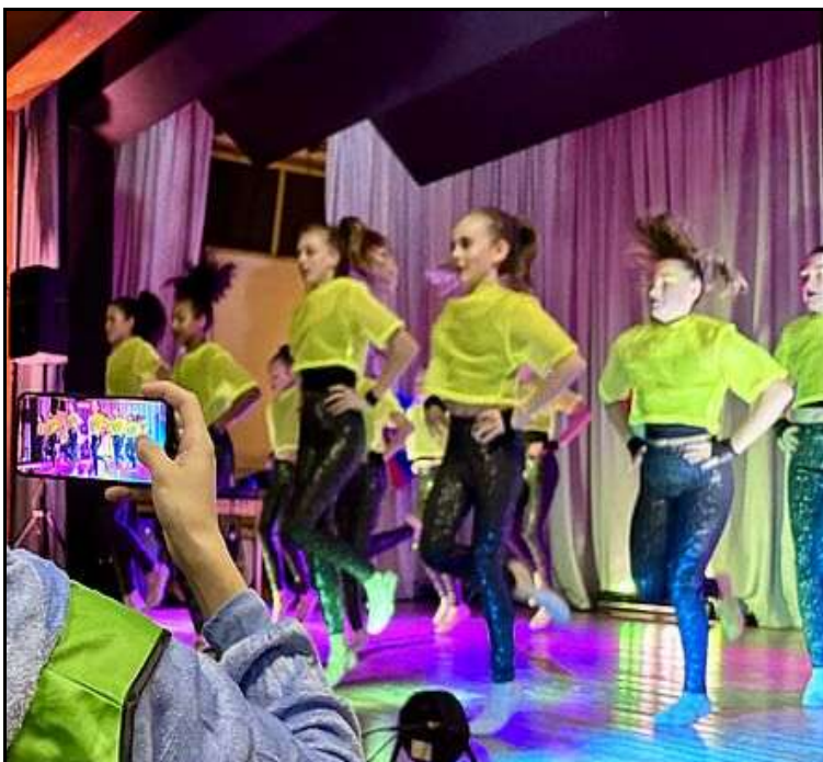
Auftritt Heime Scheuern