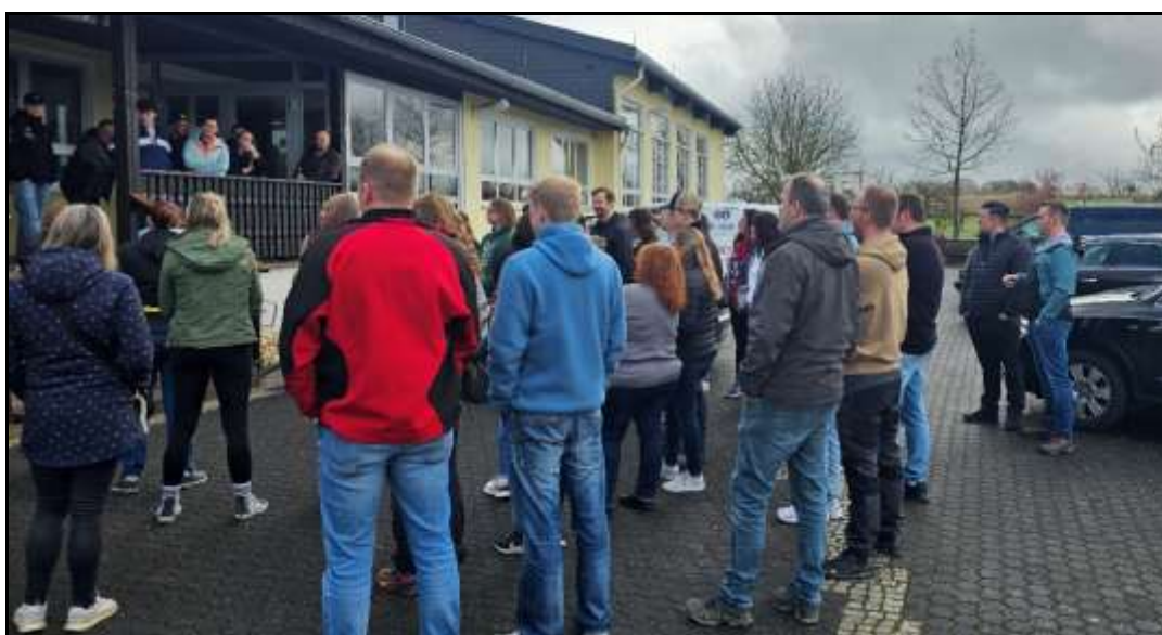
Die Teilnehmer der Bildersuchfahrt bei der Fahrtbesprechung

Diesmal führte die Tour in den Raum Limburg-Weilburg. Während der Fahrt waren neben den Aufgaben in der Mappe insgesamt 5 Spiele zu erledigen. Das Orgateam hatte sich hier sehr schöne Aufgaben einfallen lassen. Es gab einen Kettcar-Parcours, der auf Bestzeit durchfahren werden musste, 2 Geschicklichkeitsspiele und 2 Schätzspiele, bei denen es darum ging, verschiedene Gewichte zu schätzen.